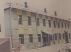
По завершении внутреннего ремонта подложит уборку от строительного мусора и территории.

Помещение здания по улице Фрунзе, 78 ремонтируется под размещение детского поликлинического отделения с учётом всех требований к размещению «Бережливой производств». Данная программа федеральная. Капитальный ремонт ведётся на средства федерального бюджета. Работы ведёт фирма из Екатеринбург. Они, к сожалению, с заданной не справляются. Для оценки качества выполненных работ нами привлечена сторонняя организация. Результат отрицательный. Поэтому с данной фирмой мы, очевидно, будем прощаться и снова работы проводить как должно по проекту.